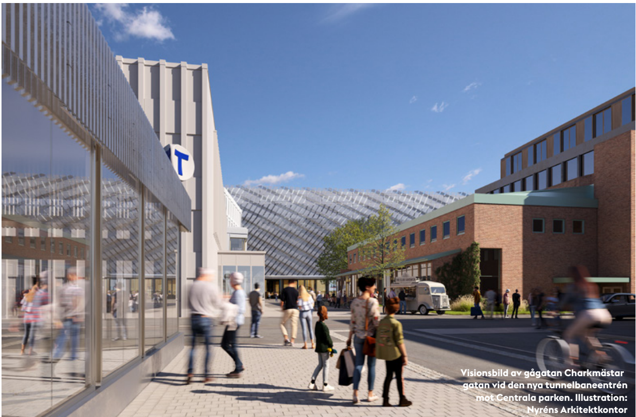
Visionsbild av gågatan Charkmästargatan vid den nya tunnelbaneentrén mot Centrala parken. Illustration: Nyréns Arkitektkontor