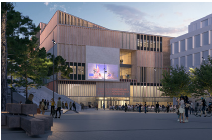
Visionsbild på Stockholms konstnärliga Högskola (SKH). Illustration: 3XN