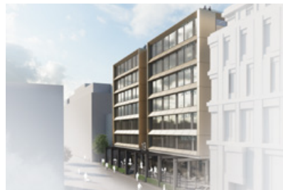
Visionsbild kvarter T: Ny kontorsbyggnad med möjlighet till centrum, verksamheter och vård. Illustration: Gatun