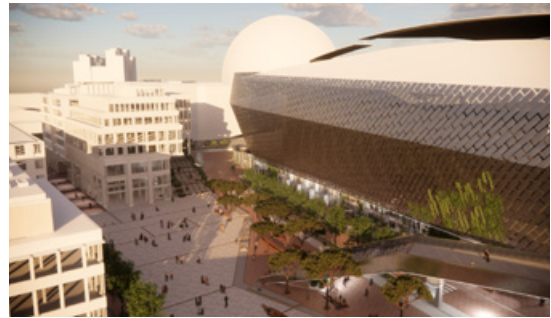
Visionsbild av Stockholmsarenan, TOLV Stockholm samt nya broar och trappor över Arenavägen. Illustration: CF Möller