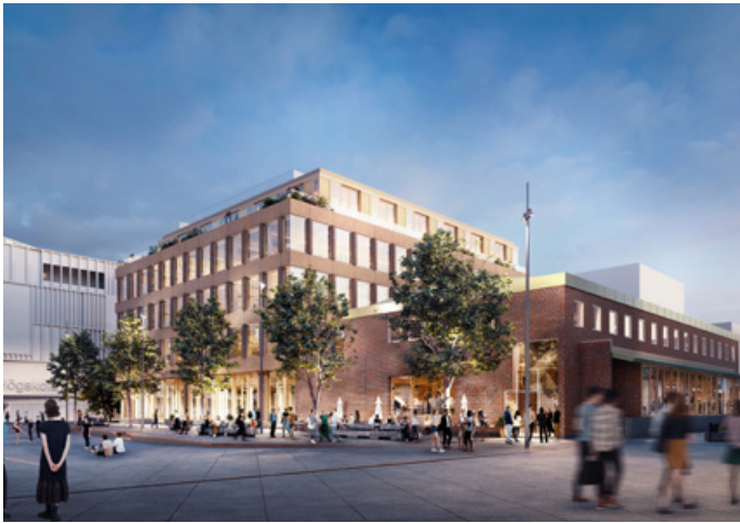
Visionsbild kvarter O och P: Nya kontorsbyggnader med centrum, verksamheter och vård. Kvarter O är en kulturhistoriskt värdefull byggnad som bevaras med nytt innehåll. Illustration: White