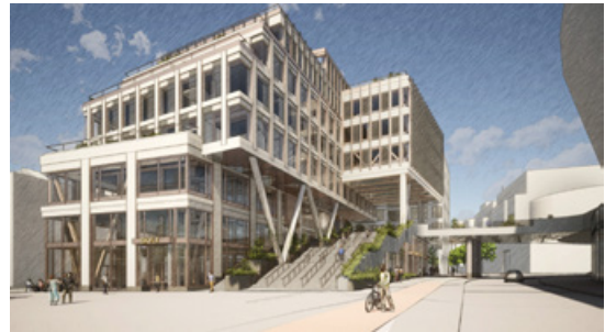
Visionsbild kvarter M: Ny kontorsbyggnad med centrum, verksamheter och vård. En trappa i byggnaden leder från Evenemangstorget till arenorna. Illustration: Wester+Elsner